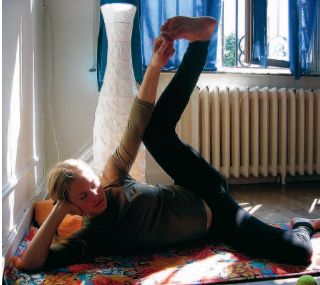
Le yoga prénatal, une des nombreuses méthodes qui sera en démonstration. ■ WWW.ALTERNATIVES.BE

Absolument pas! D'ailleurs, nous avons invité toutes les maternités du Hainaut à notre journée. Et certaines ont déjà